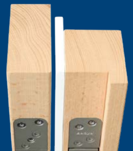
Tür 180° geöffnet