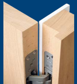
Tür 90° geöffnet